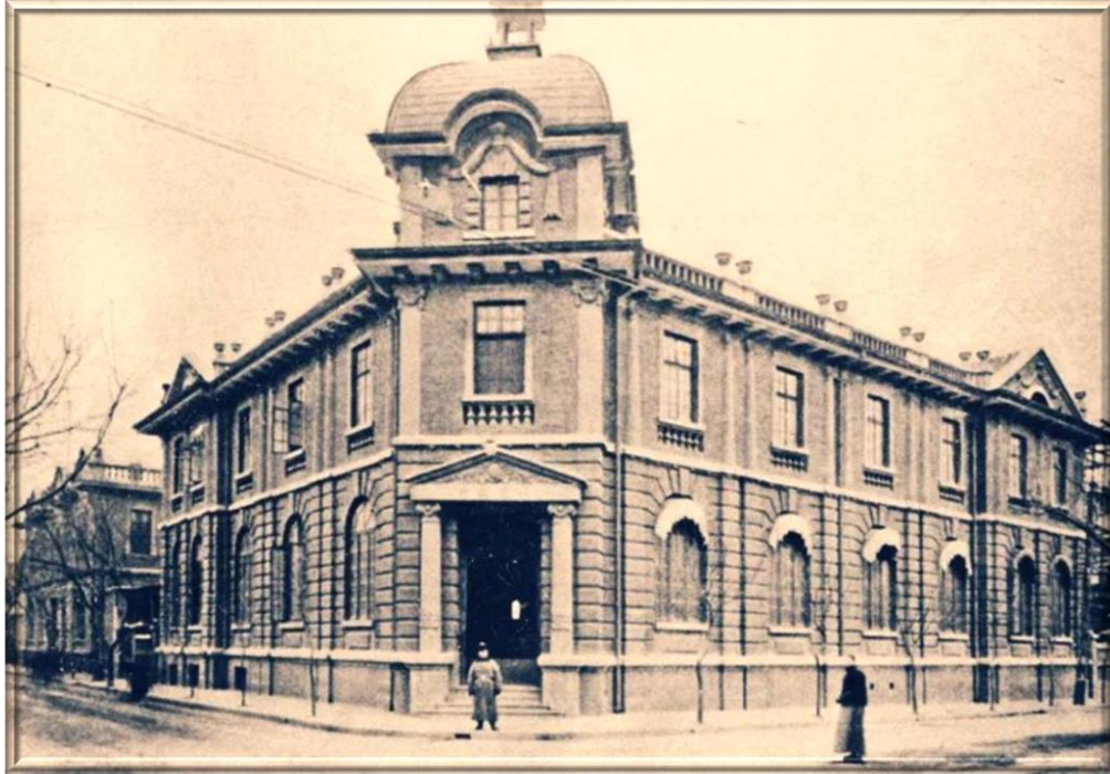
1912年10月11日，中國銀行在天津設立分行（現天津市和平區解放北路與赤峰道交界）

On 11 October 1912, the Bank of China established a branch in Tientsin.