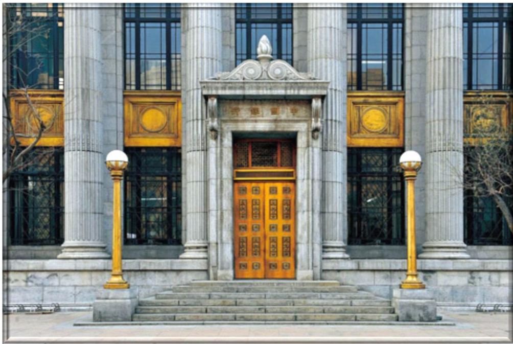
中華民國時期 -- 中國銀行天津分行舊址

On 11 October 1912, the Bank of China established a branch in Tientsin.