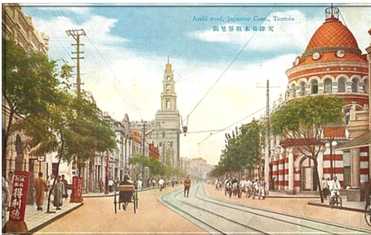
1935 年的天津街景 Tientsin street scene in 1935