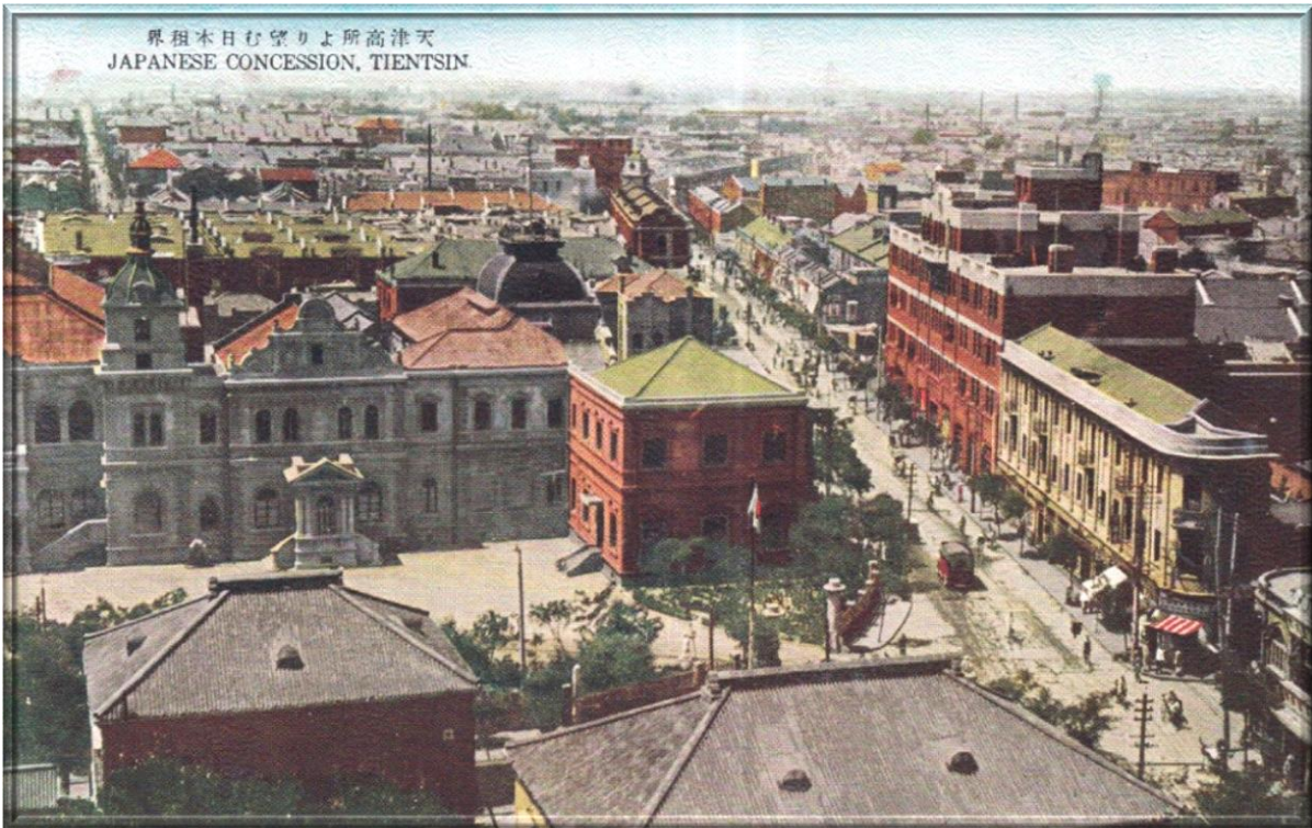
1935 年的天津街景 Tientsin street scene in 1935