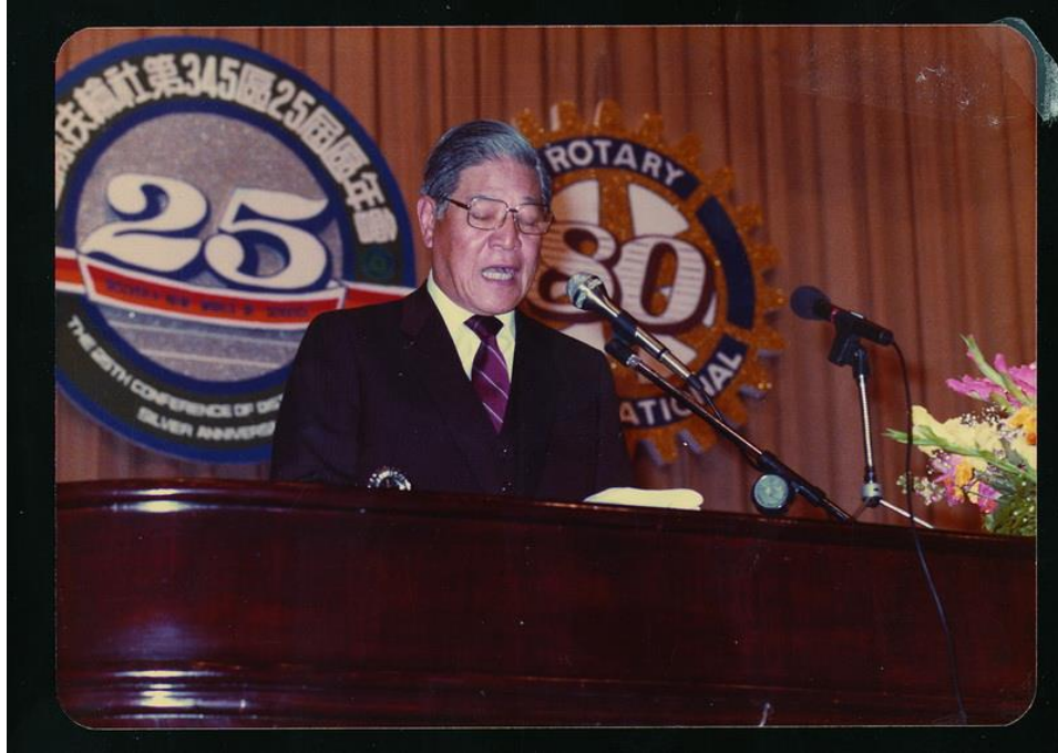
中華民國副總統李登輝先生主題演講