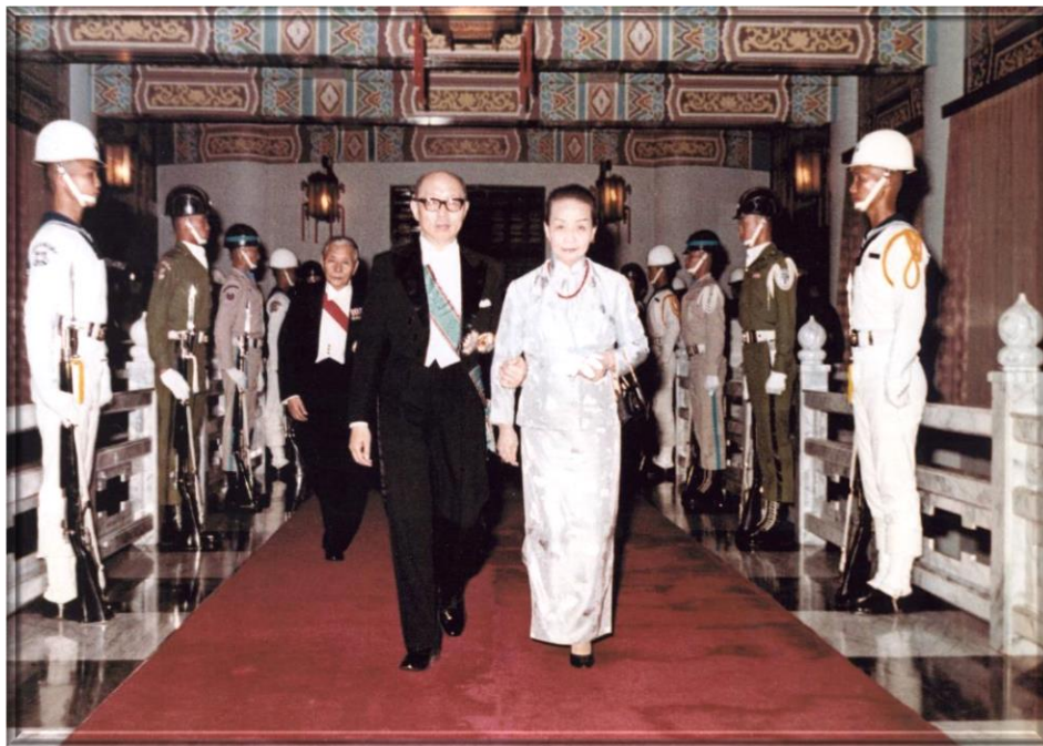
1975年4月 — 中華民國總統嚴家淦偕夫人劉期純

Republic of China's President Chiang Kai-Shek, Vice President C. K. Yen, and their ladies – March 1972