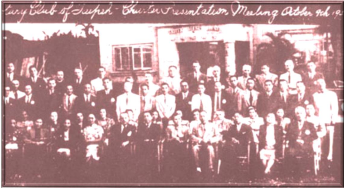
1948年10月9日臺北扶輪社舉行授證儀式後的全體合影

Group Photo of the Charter Presentation Meeting of Taipeh Rotary Club on 9 October 1948