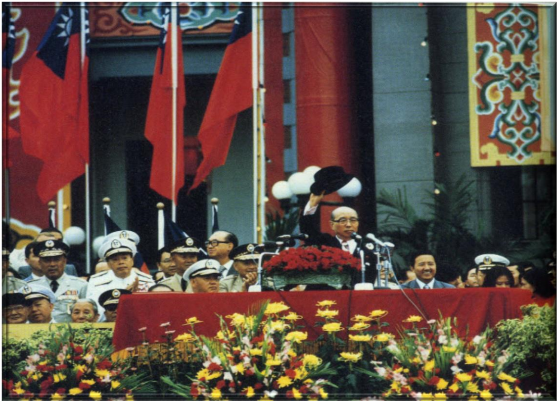
嚴家淦總統主持國慶大典

Group Photo of the Charter Presentation Meeting of Taipeh Rotary Club on 9 October 1948