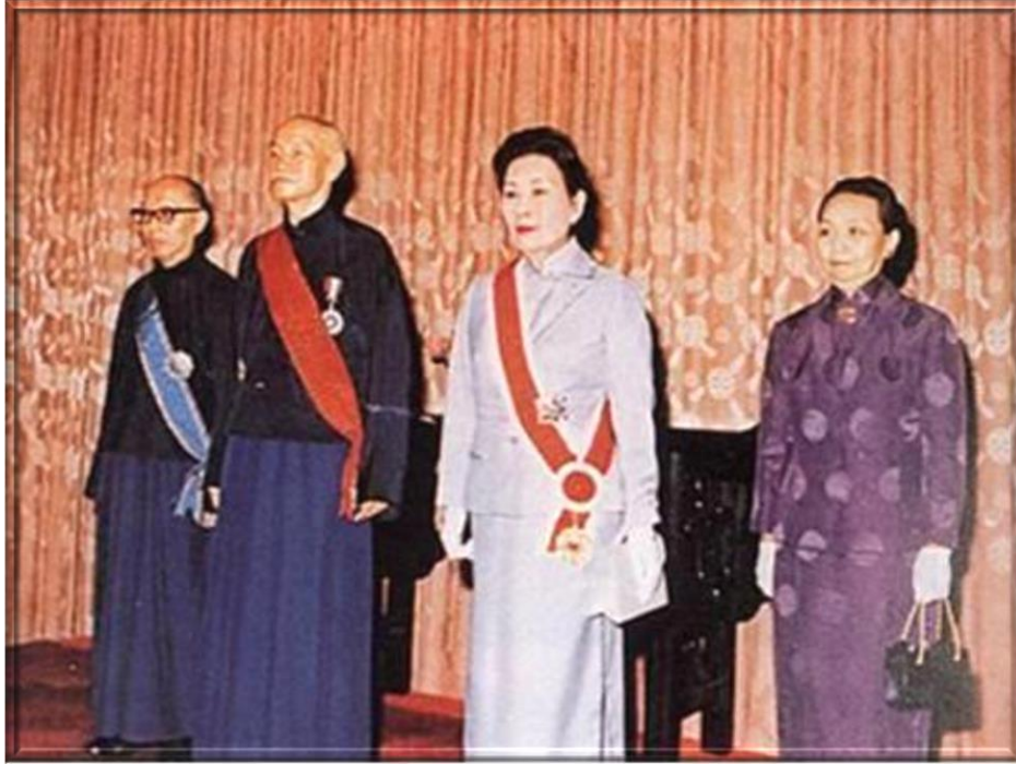
1972年3月 — 中華民國總統蔣中正伉儷，副總統嚴家淦伉儷

Republic of China's President Chiang Kai-Shek, Vice President C. K. Yen, and their ladies – March 1972