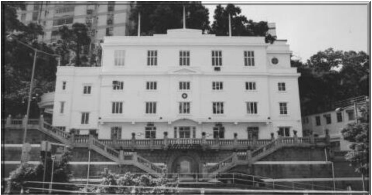
1933 年 -- 「周雨亭樓」香港聖約翰救傷會總部大廈

1933 -- [Chau Yue Teng Building] Hong Kong St. John Ambulance Association Headquarters