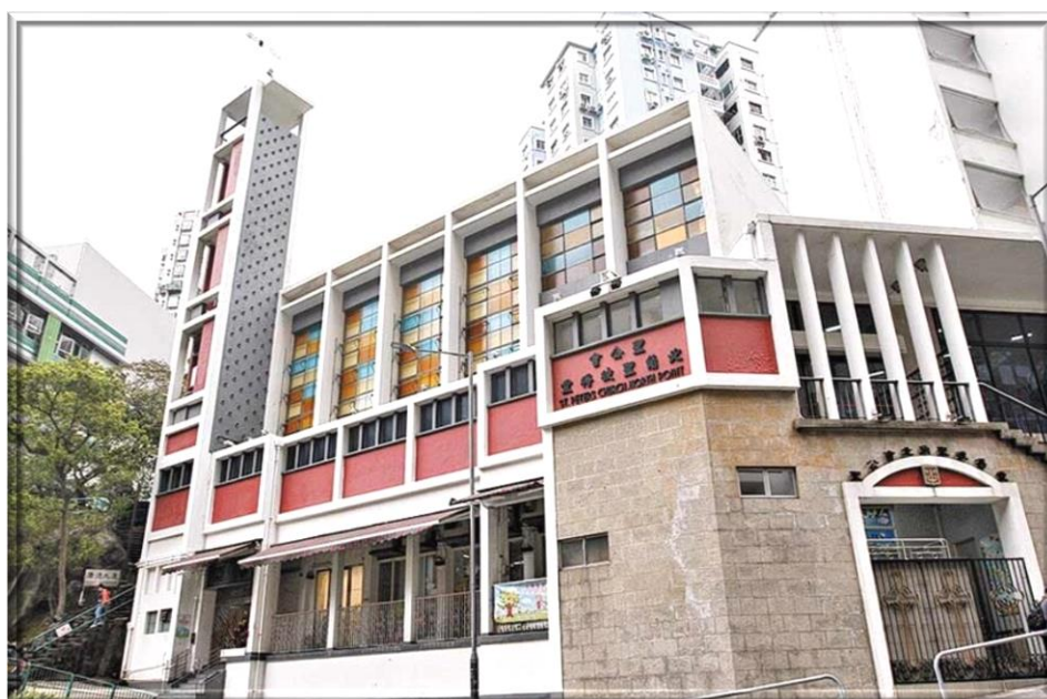
聖公會北角聖彼得堂

1935 – The third generation head office building of the Bank of East Asia