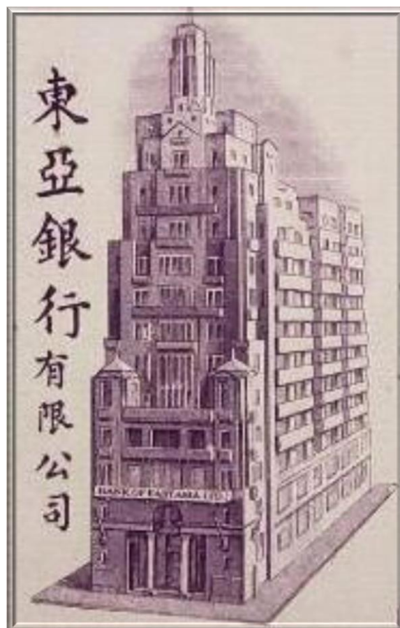
1935 年 -- 東亞銀行第三代總行大樓

1935 – The third generation head office building of the Bank of East Asia