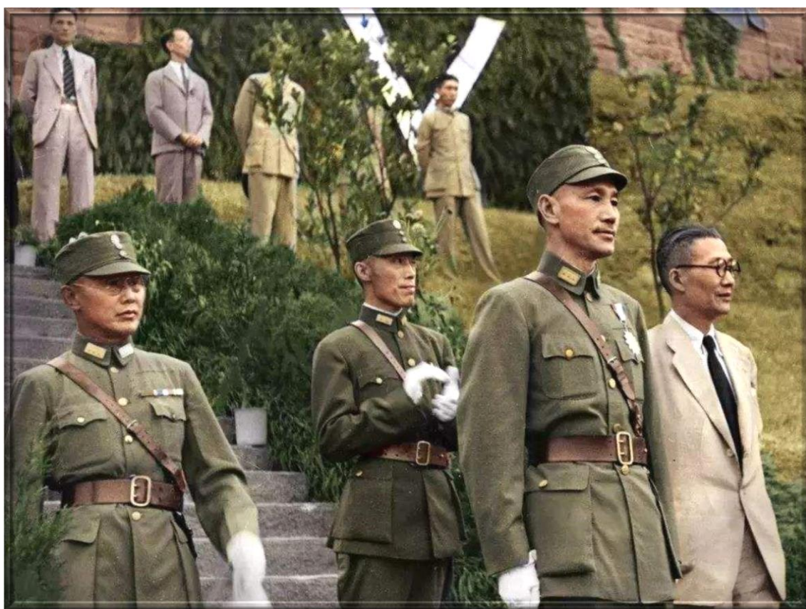
抗戰中的蔣介石和吳鐵城