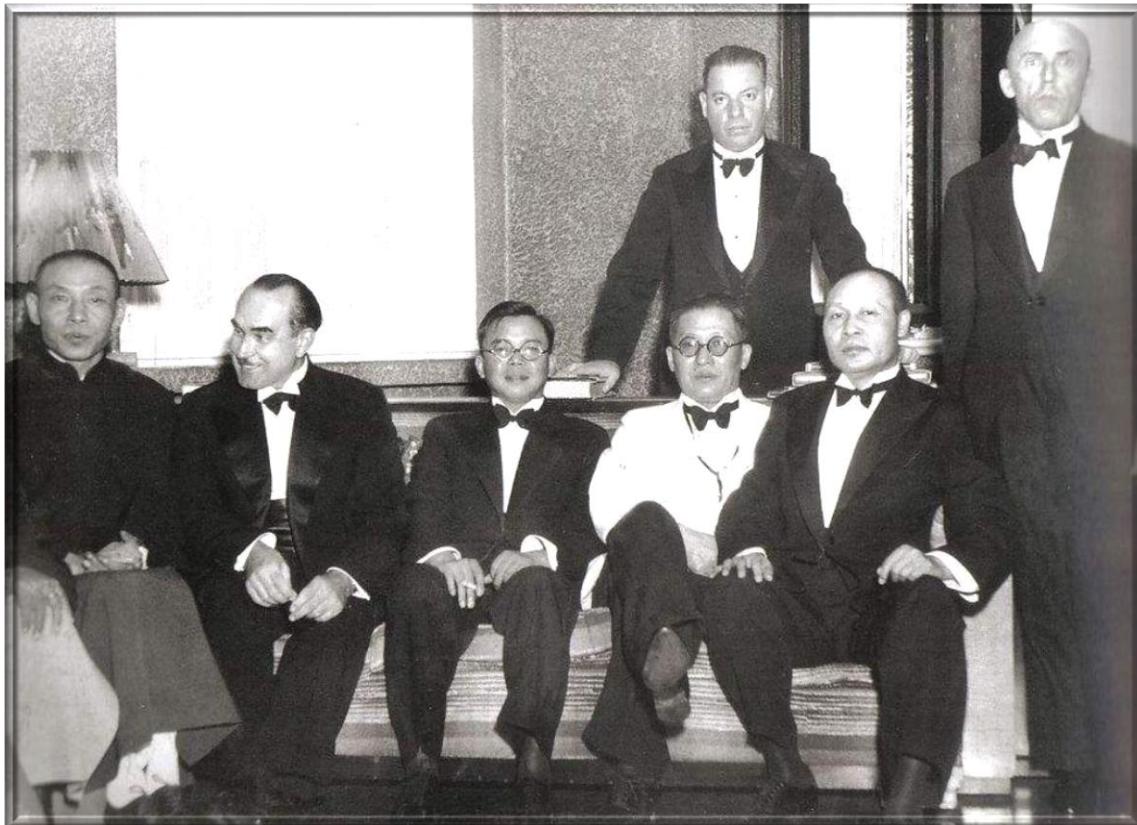
民國二十三年上海市長吳鐵城（白色西裝）與杜月笙（左一）、商界領袖等人合影