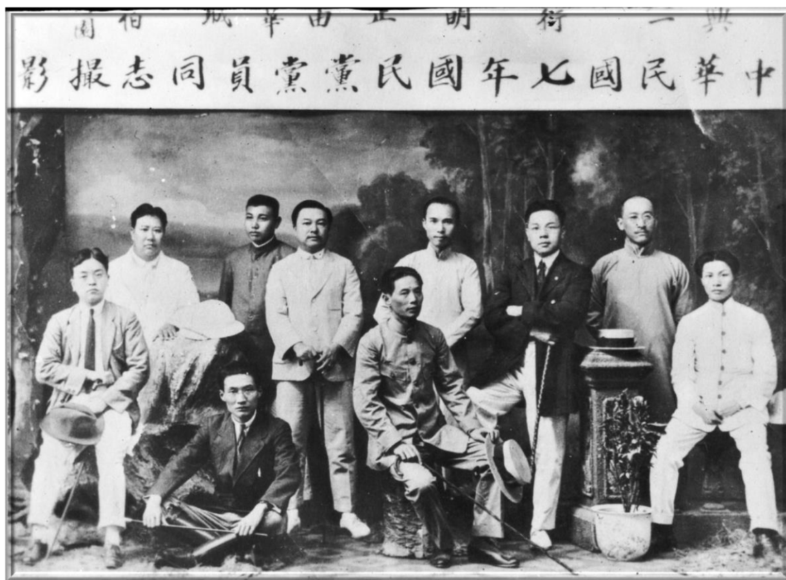
民國七年中國國民黨黨員同志合影，前坐在地板上為吳鐵城