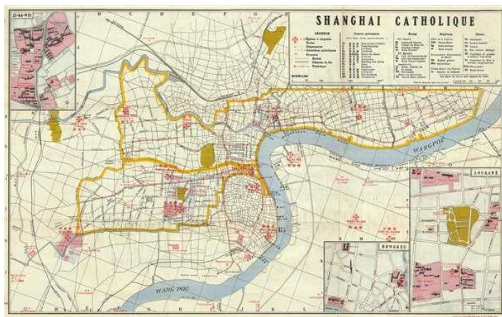
1933 年大上海地圖顯示天主教傳教團位置

After communists were purged from the Kuomintang ( Nationalist Party ) (中國國民黨) in the Canton Coup (中山艦事件) in 1926, Chiang Kai-Shek (蔣中正) negotiated a compromise whereby hardline members of the rightist faction, such as Wu, were removed from their posts in compensation for the purged leftists in order to prove his usefulness to the Communist Party of China (中國共產黨) and their Soviet Union sponsor, Joseph Stalin.