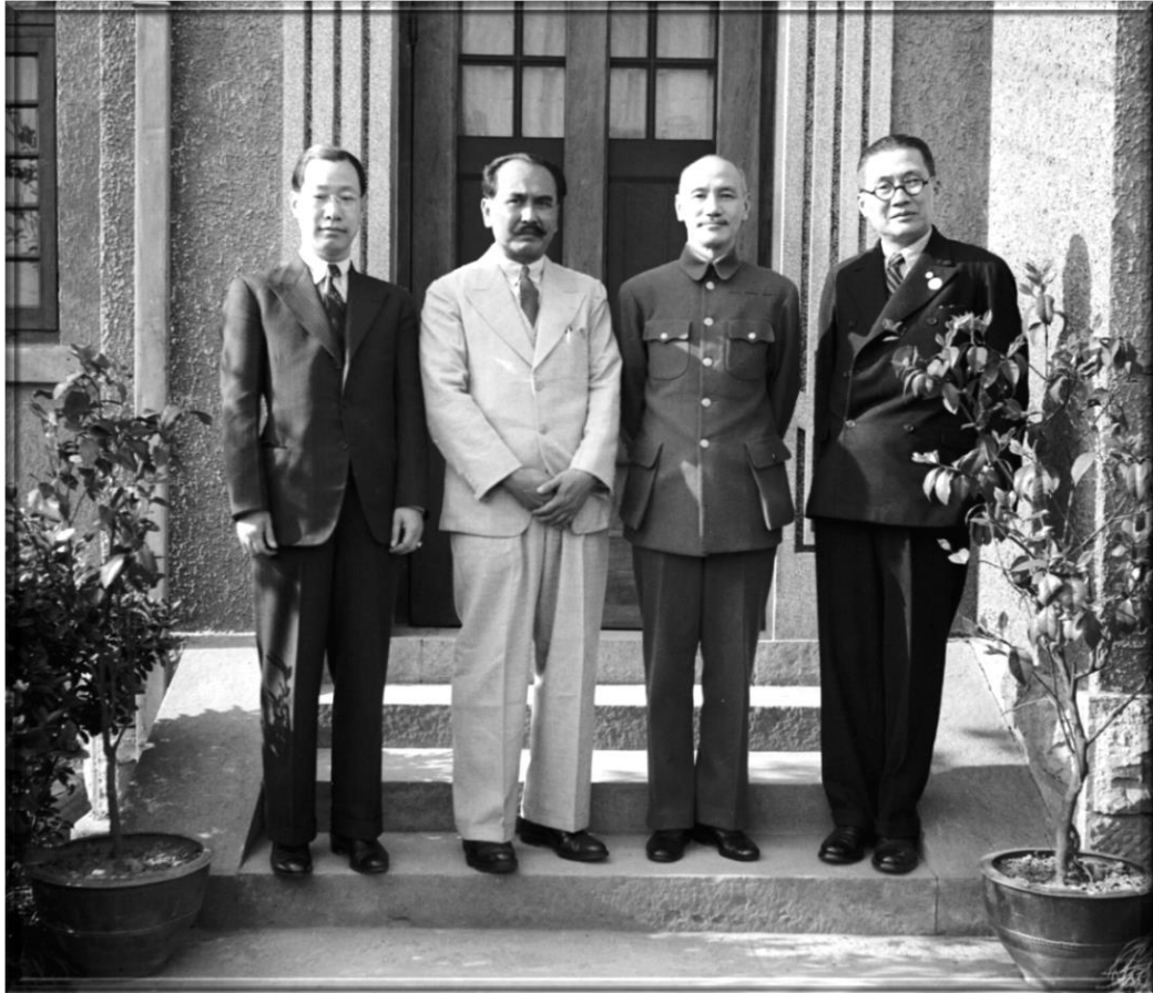
民國二十九年四月一日南洋僑胞陳清虎謁蔣中正委員長，右起吳鐵城、蔣中正、陳清虎。