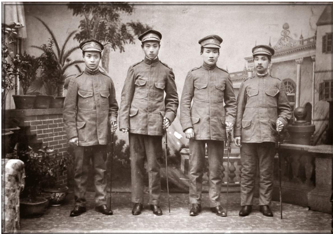
民國前二年吳鐵城(右二)著革命服與林森(右一)合影