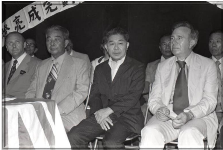
1978年5月2日 -- 兩位新界扶輪社員：新界政務司鍾逸傑（右一）和新界鄉議局主席陳日新（右二）出席大嶼山大地塘村的路燈亮燈儀式，為新界民政署轄下HK$450,000村莊照明計劃的一部分。 2 May 1978 – Two New Territories Rotarians: David Akers-Jones (right), Secretary for the New Territories, and Chan Yat-Sun (second from right), Chairman of Heung Yee Kuk, attending the switching-on ceremony in Tai Tei Tong Village on Lantau to inaugurate street lights installed as part of a HK$450,000 scheme to bring light to villages under the New Territories Administration.