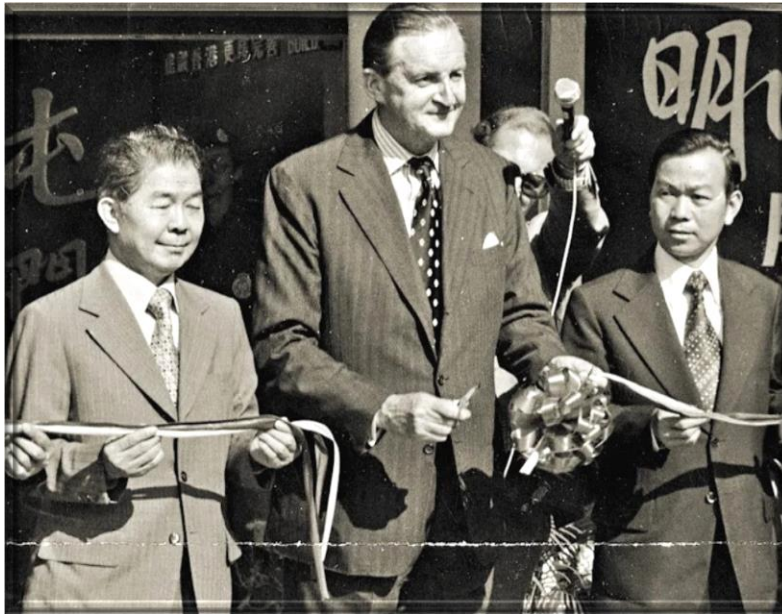
1974年，香港政府為配合將「青山區」更名為「屯門區」，故將「青山邨」同時易名「新發邨」。「新」是屯門鄉事委員會前主席陳日新，「發」則是現任主席劉皇發。政府為表揚兩人之貢獻，故以兩人之名字為屋邨命名。

Sketch Map of Hong Kong --- The green area indicates the service territory of the Rotary Club of New Territories, according to the Club's Constitution and Bylaws.