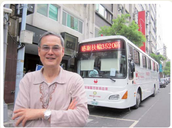
巧遇總監年度捐贈的扶輪圓百號捐血車出車服務