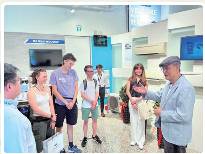
接待德國 D1900 NGSE 參訪團於大金空調 Showroom 導覽

物，如何在短時間吸引滿室目光，以及如何叫醒課堂上總是昏昏欲睡的大學生。拉斯維加斯魔術大師大衛考柏菲高潮迭起的現場秀，觀眾看得目不轉睛驚聲連連，這種特別受到聽眾矚目的回饋和效果，就是他要的。於是，拜師羅賓、蔣昊等名師學魔術，除演講中神來一筆，或自家企業活動中表演，2008年，也應邀到張菲主持的「大魔鏡」演出，老師們甚至鼓勵他往魔術界發展。