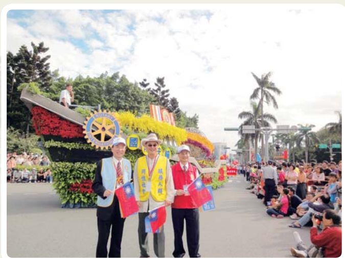
圓百扶輪號花車遊行