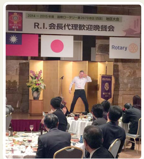
2015 年擔任 D2670 RIPR 在歡迎晚宴上不忘表演魔術