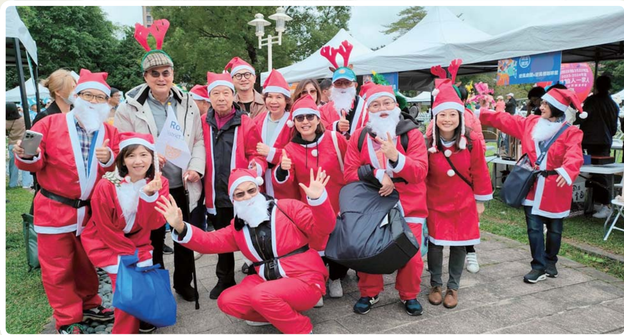
參與地區 DEI 園遊會遊行活動

撐到 100 公斤的傳言屬實。另外，清晨「拍打功」，以雙手拍打全身，促進血液循環，達到醒腦、活絡經脈等功效。