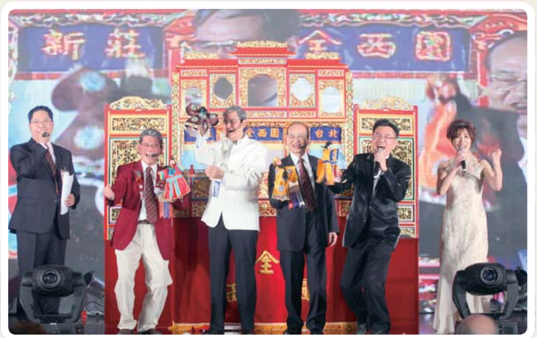
地區年會首次以 LED 螢幕呈現，並以布袋戲演出總監的生活