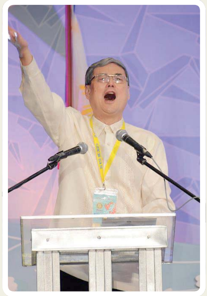
2013 年擔任 D3800 RIPR 演講 慷慨激昂

教授不過激的瑜珈半小時到一小時。瑜珈的伸展，需與呼吸合一，對交感神經起安定作用，腹肌有力，走路更穩，身體不適的症狀顯著改善。同年《董事長陪你輕鬆做瑜珈》問世，親自示範 77 招簡單易學的招式。分送各界，盼健康運動大家一起來。