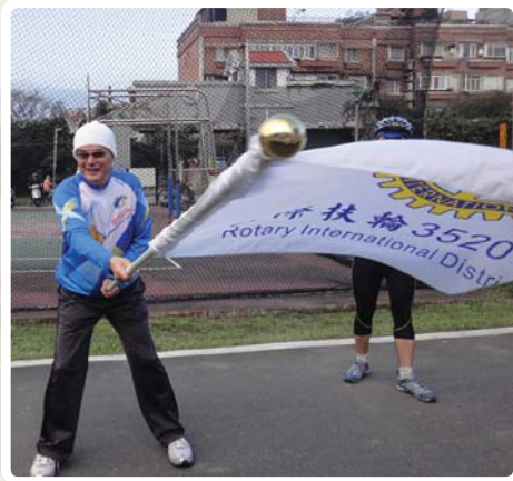
↑ 圓百總監舞大旗，為地區愛心騎士環島掀開序幕 愛心騎士上路，為喜願兒而騎 →