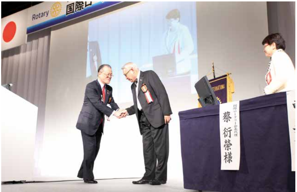
PP ER (中) 擔任國際扶輪社長代表出席 2580 地區年會