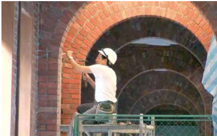
工人整修紅樓拱廊

樂器、制服和配備當後援團，整團至少上百人需安置、管理。當時 ER 的基金會成立，所以一路贊助樂旗隊出國樂器的運送、教練費等等 16 年。