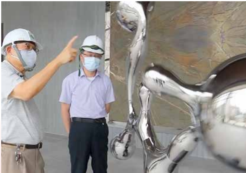
提供可讓學童玩耍的旋轉藝術雕塑

38 年來，仁愛社社友參加過國際年會，除 ER 之外大概只有一兩位。2024 年有感新加坡的國際年會離台灣又近，一樣是華文、華人社會但和台灣就是不一樣，必須身歷其境去感受，在 ER 號召之下總共帶了