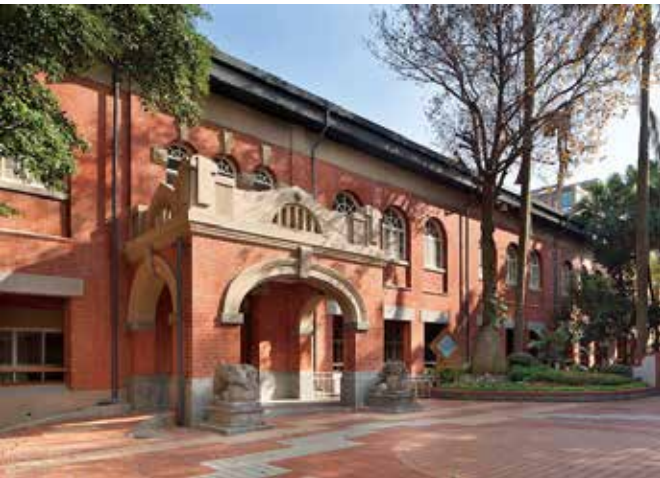
日新國小紅樓修復完成