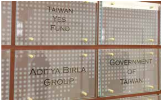
扶輪世界總部名人牆上 Taiwan Yes Fund