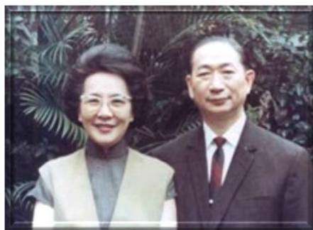
嚴慶齡、吳舜文伉儷

嚴慶齡 (Yen Tsing-Ling) (1909-1981)，臺灣汽車之父，是臺北扶輪社 (Taipei Rotary Club) 1967-1968 年度社長。當年的臺北扶輪社，是國際扶輪 345 地區的一員。345 地區的地理區域，包括中華民國臺灣省、英國殖民地香港、葡萄牙屬地澳門。1967-1968 年度的總監是 John Louis Marden (約翰馬登) (香港扶輪社 Hong Kong Rotary Club)，年度主題是「發揮您們扶輪的效能」(Make Your Rotary Membership Effective)。在 1971-1972 年度，嚴慶齡擔任了地區總監代表(今天的職稱是「助理總監」)，負責監理臺灣境內所有扶輪社。