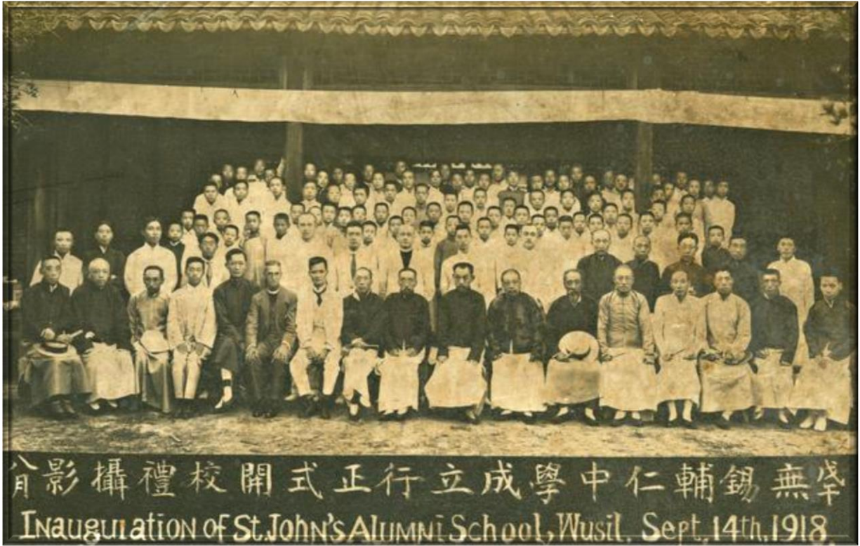
1918年9月14日(戊午年八月)輔仁中學成立行正式開校禮