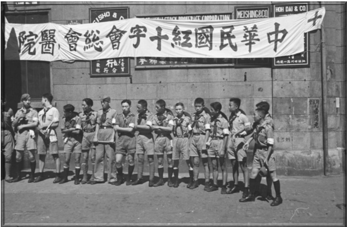
1937年—上海證券公司變身為臨時紅十字會醫院，中國童子軍參與急救戰火下受傷者任務。