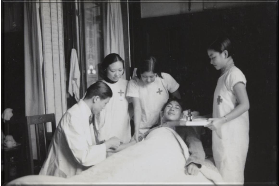
1937年—受傷的士兵在上海紅十字會醫院接受治療。