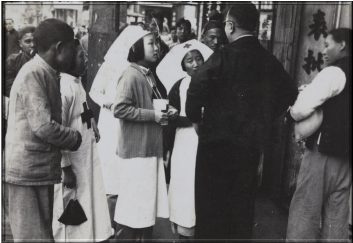
1937年12月—中國紅十字會護士在上海南京路呼籲捐款救援難民營。