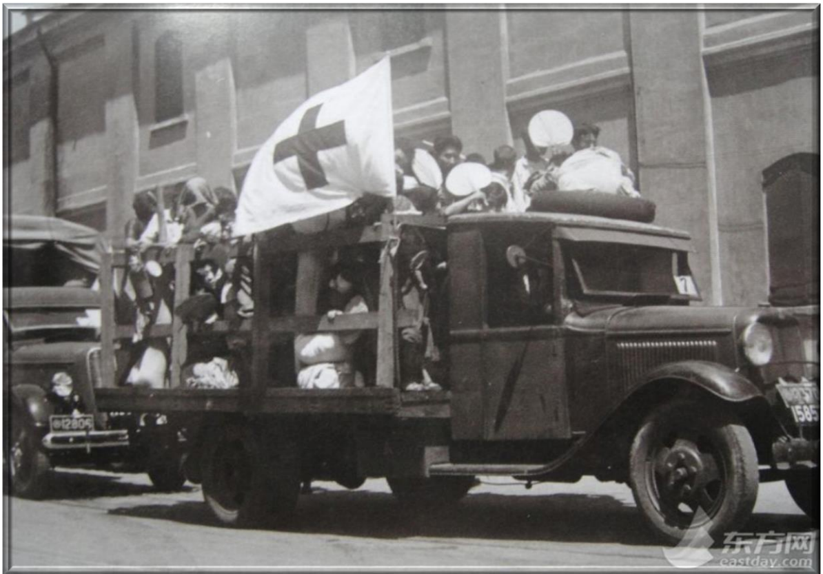
1937年8月 -- 淞滬抗戰，中國紅十字會上海紅十字煤業救護隊50多輛卡車運送傷兵和難民。