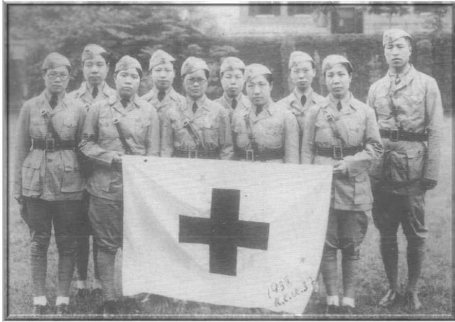
1938年--中國紅十字會救護總隊第37分隊成員合影。