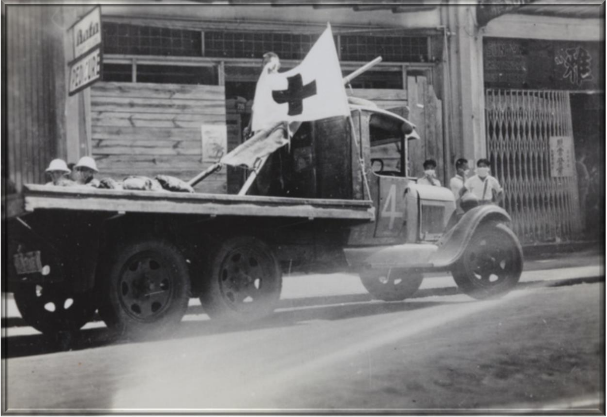
1937年8月23日—日本帝國轟炸上海先施公司和永安百貨後，紅十字會志工參與救援。