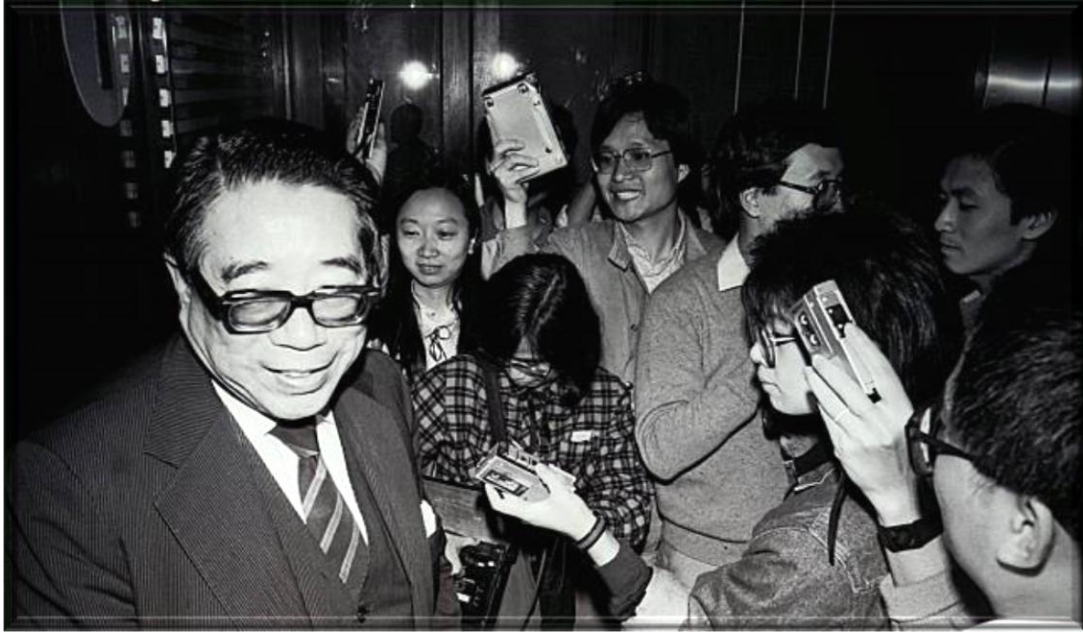
1986年4月黃保欣接受記者採訪，然後前往北京討論起草香港特別行政區基本法。 Wong Po-Yan speaking to reporters in April 1986 before leaving to Beijing for discussions about the drafting of the Hong Kong Special Administrative Region Basic Law.