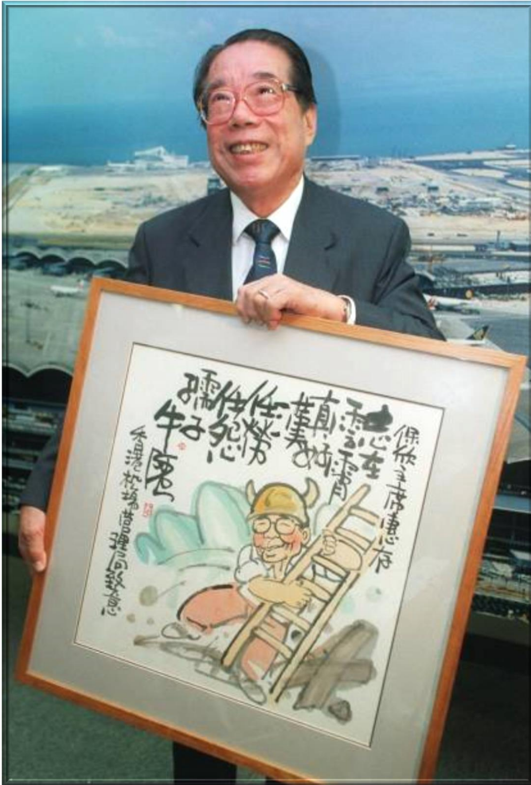
1999年5月31日—香港機場管理局主席黃保欣榮休紀念歡送會。31 May 1999 -- Farewell party for Wong Po-Yan, Chairman of the Hong Kong Airport Authority.