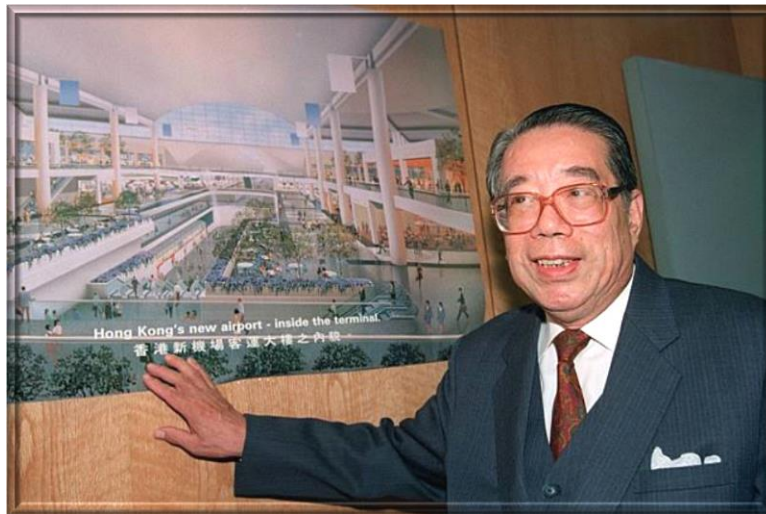
1995年11月接受任命為機場管理局主席後，黃保欣與畫家筆下未來香港國際機場的構想圖合照。 Wong Po-Yan, pictured with an artist's impression of the future Hong Kong International Airport, upon being appointed chairman of the Airport Authority in November 1995.

Dr. The Honourable Wong Po-Yan passed away in Hong Kong within the early hours on Monday, 21 July 2019, aged 96. He will always be remembered for his ardent support and distinguished contributions to the Hong Kong community.