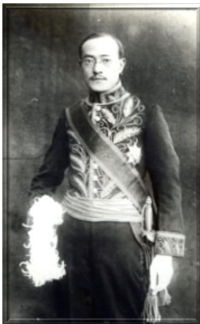
王正廷博士 -- 中華民國駐美國大使 1936 年 8 月-1938 年 9 月 Dr. Chengting Thomas Wang – Ambassador of the Republic of China to U.S.A. 1936-1938

Even in a city renowned for its commanding estates, Twin Oaks stands out for its understated beauty and historic pedigree. Yet, while the gala events held at other such grand homes are routine fodder for the social pages of Washington's newspapers, the owners of this particular residence tend to keep their own council. Reason: It is, in fact, a symbolic embassy. A virtually invisible embassy but an embassy nonetheless. The first "occupant" who made this beautiful complex into the ambassadors' residence was Dr. Chengting Thomas Wang (王正廷博士), HonLLD (Peking) , HonLLD (St. John's) , BA ( Yale ), (1882-1961), the 2nd Ambassador Extraordinary and Plenipotentiary of the Republic of China (中華民國) to the United States of America, or in Rotary, the immediate resigned Governor of the 81st District of Rotary International. That was the story in 1937.