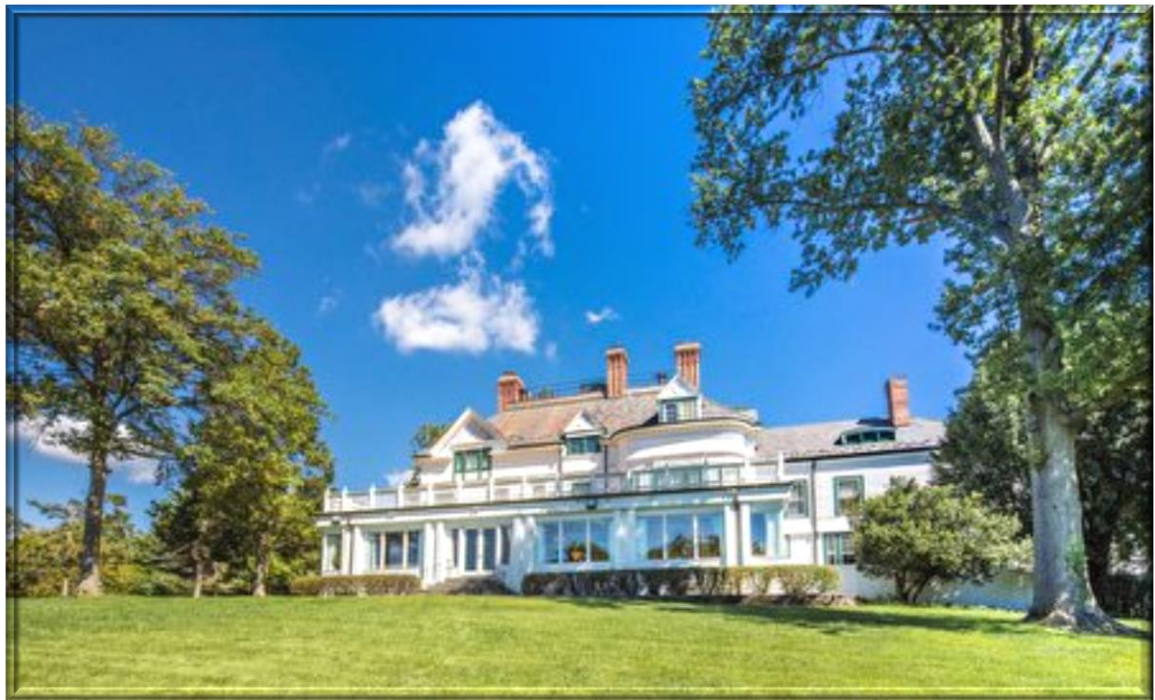
柯錫杰鏡頭下的雙橡園。(中華民國外交部提供)