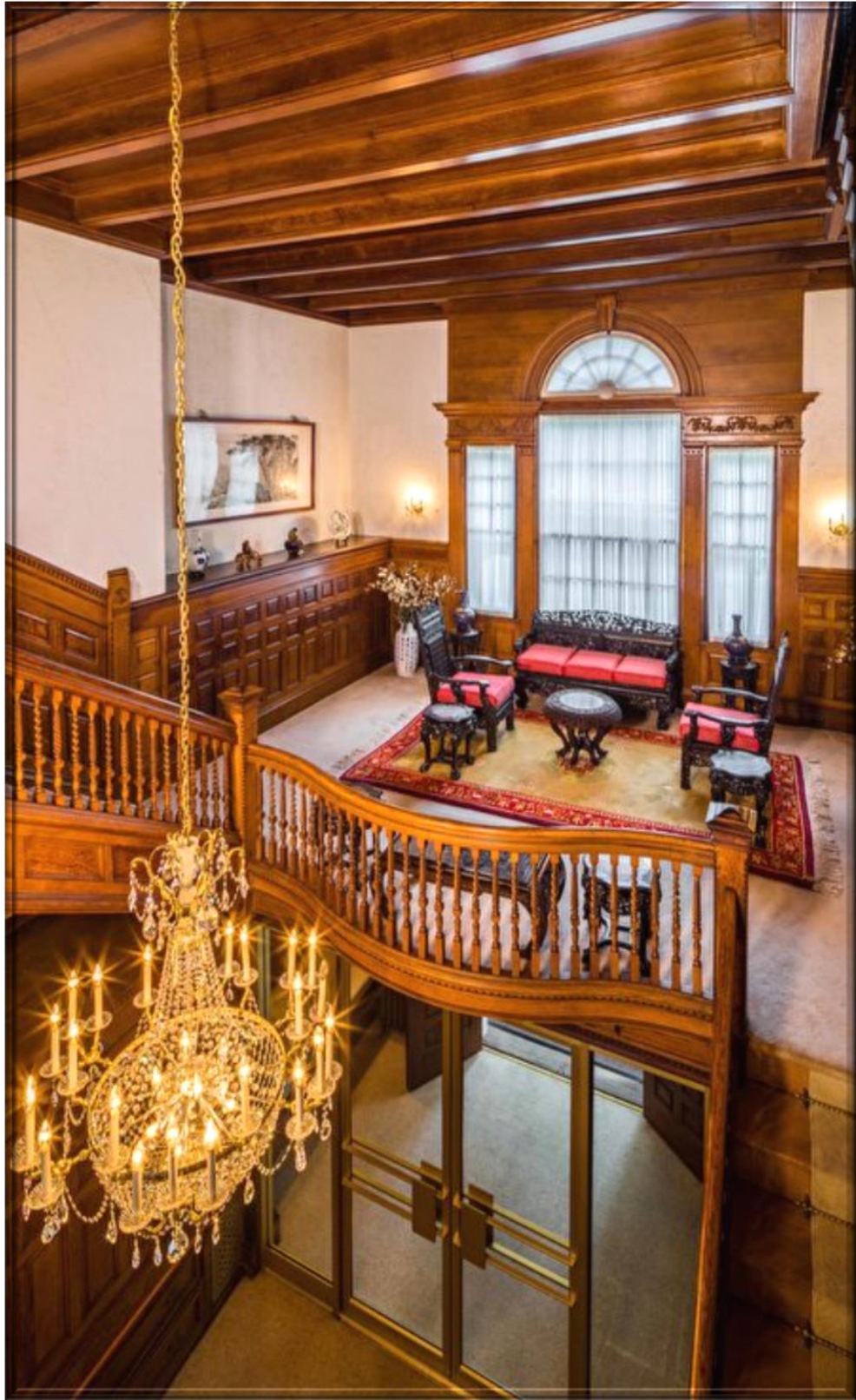
柯錫杰鏡頭下的雙橡園。(中華民國外交部提供)