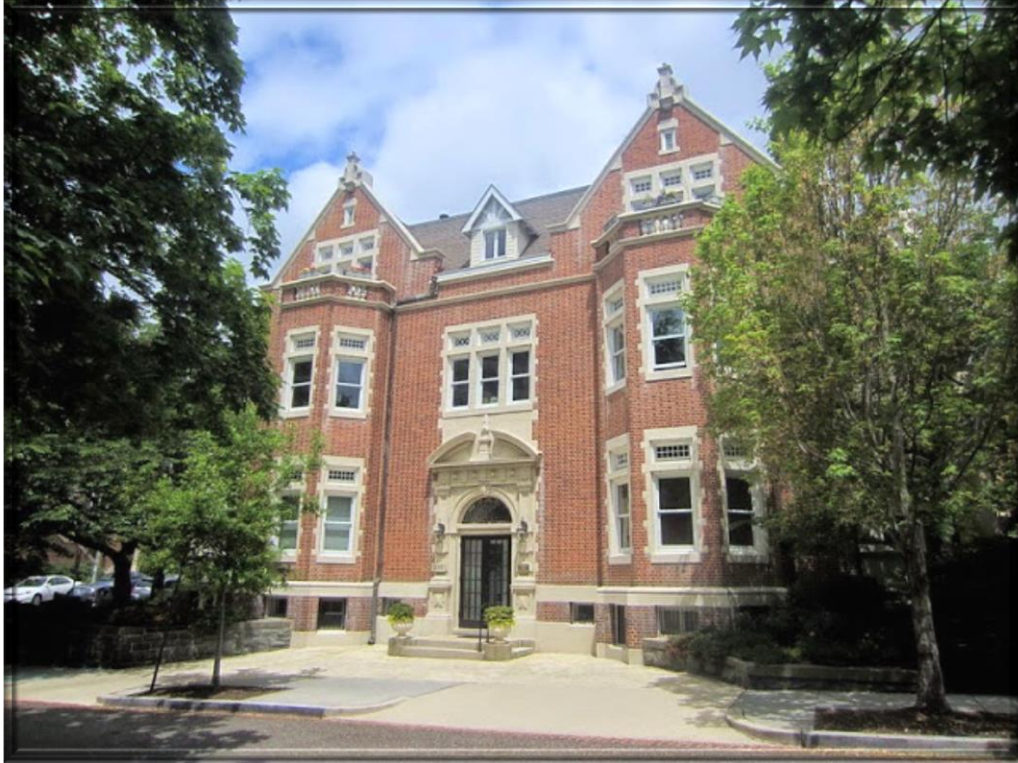
中華民國駐美國華府大使館館舍 (1911-1944) (前清廷駐美國公使館自建於 1902 年) Embassy of the Republic of China to U.S.A. in 1911-1944 (former Imperial Chinese Legation premises built in 1902, at No. 2001, 19th Avenue, Northwest Washington D.C.)