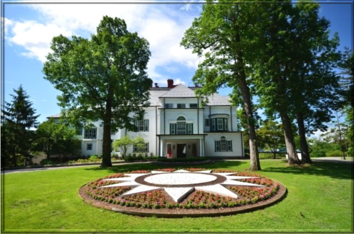
雙橡園主屋北側正面照 North Façade of the Summer House