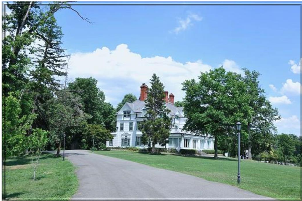
雙橡園 -- 中華民國駐美國使節官邸 (從 1937 年開始) The Twin Oaks, Republic of China Ambassador's official residence since 1937