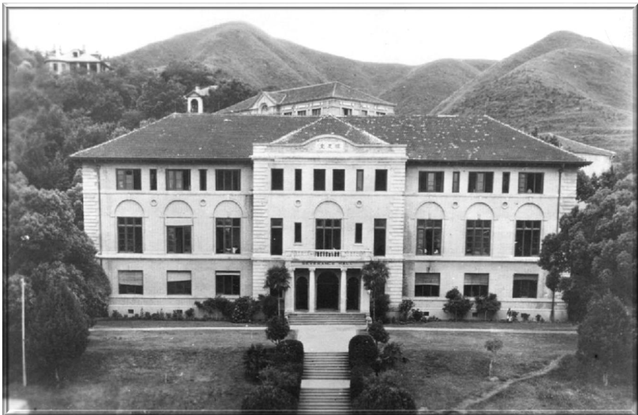
之江大學行政樓 -- 慎思堂 (Severance Hall)