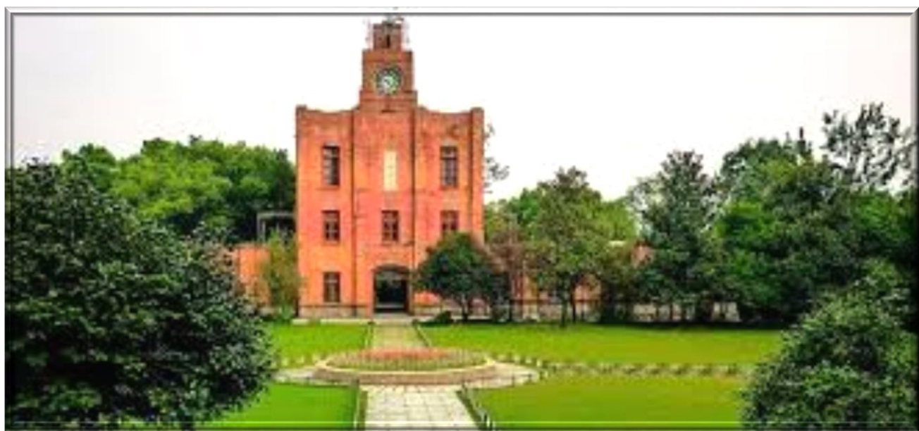
之江大學經濟學館 -- 同懷堂