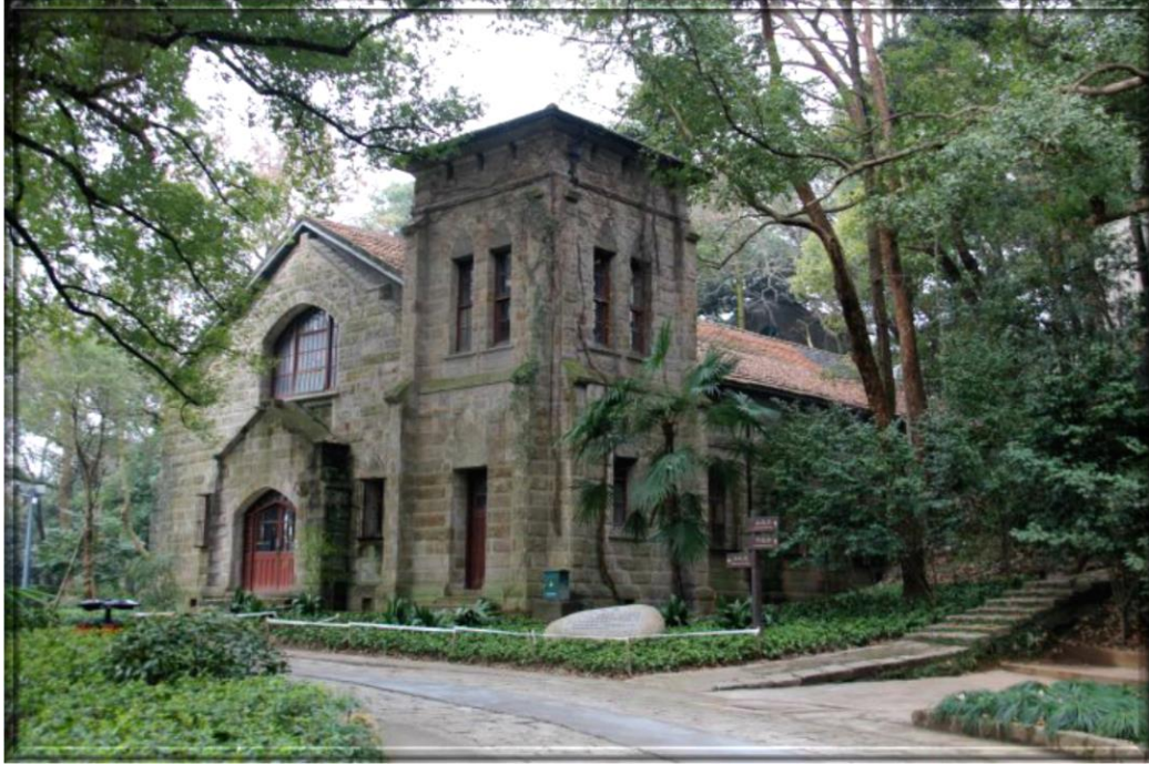
之江大學都克堂(Tooker Memorial Chapel)