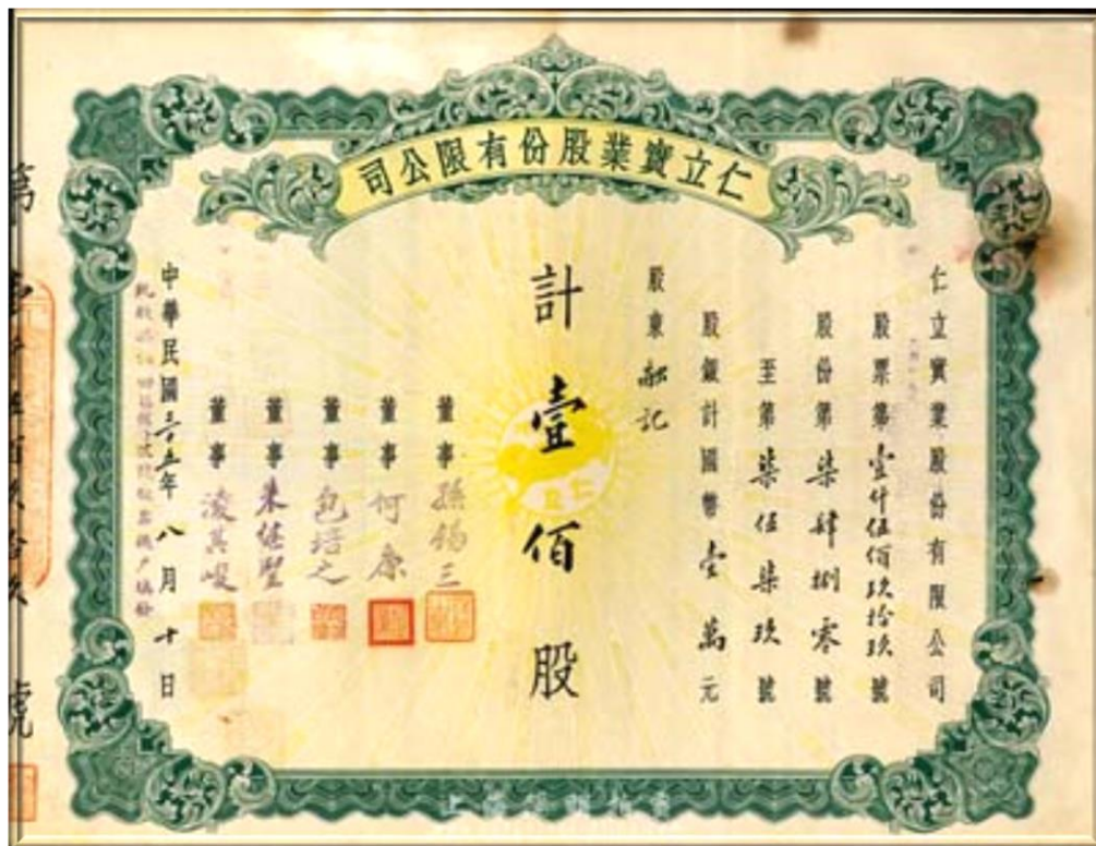
1946年仁立實業股份有限公司股票 -- 董事凌其峻、朱繼聖簽章