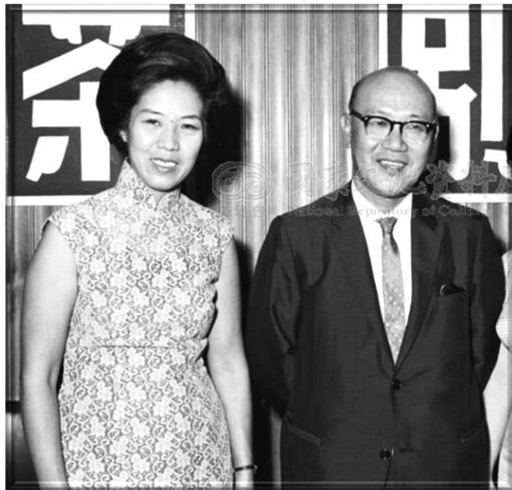
沈劍虹、魏惟儀伉儷 Mr. & Mrs. James C. H. Shen