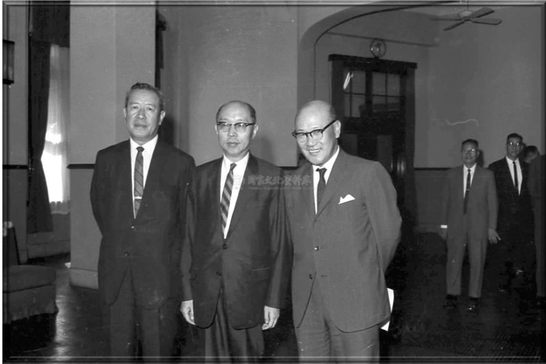
1966年10月5日沈劍虹宣誓就任中華民國駐澳大利亞大使，嚴家淦副總統(中)代表蔣中正總統監誓。 5 October 1966 – James Shen was sworn in as the Ambassador of the Republic of China to Australia. Vice President Yen Chia-Kan (middle) administered the oath on behalf of President Chiang Kai-Shek.