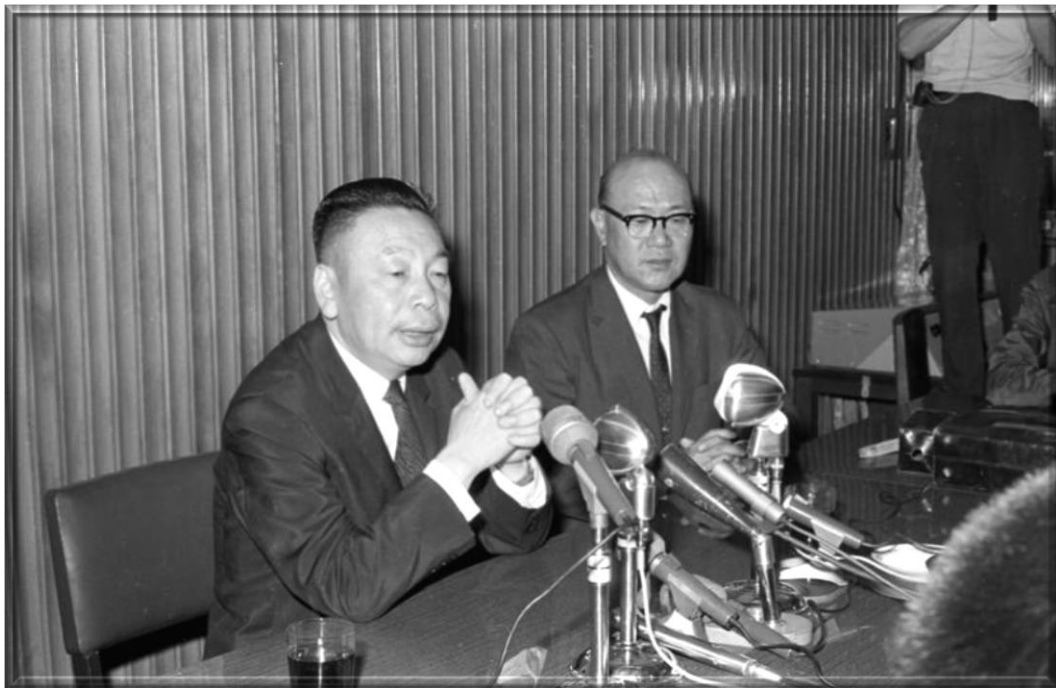
1966年 -- 中華民國國防部長蔣經國(左)訪問大韓民國後召開記者會，新聞局沈劍虹局長陪同。

9 May 1964 -- Executive Yuan President Yen Chia-Kan (right) and Government Information Office Director James Shen jointly attended the press liaison meeting.