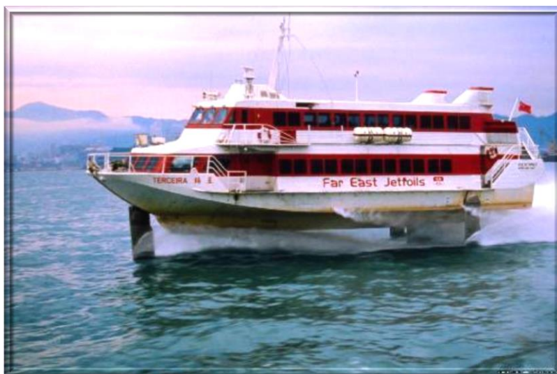
The "international" ferry sailing between Macao and Hong Kong.