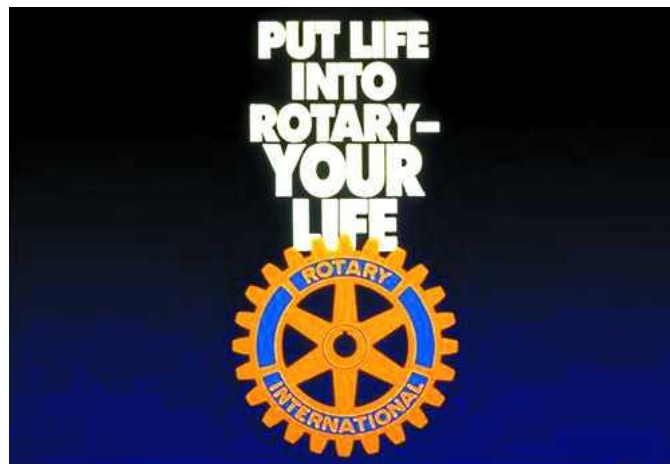
Rotary International Presidential Theme 1988-1989