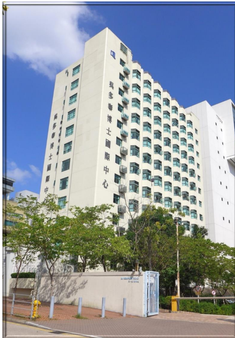
吳多泰博士國際中心 Dr. Ng Tor Tai International House