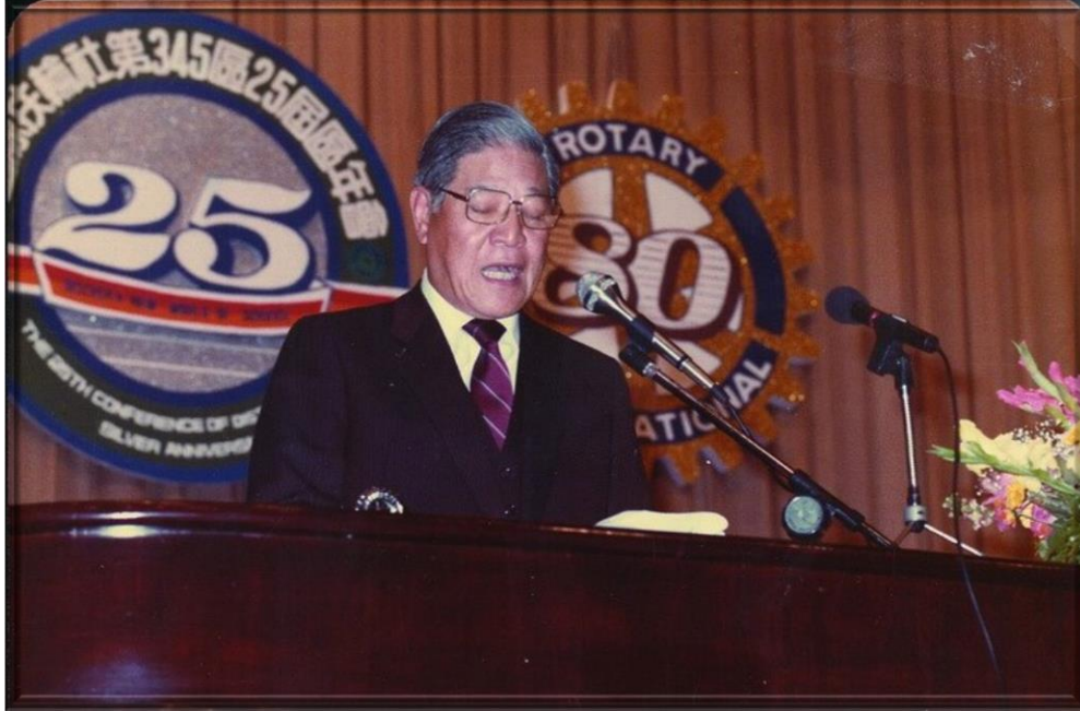
中華民國副總統李登輝先生主題演講