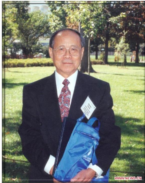
1993 年 -- 外籍院士鄭哲敏參加美國國家工程科學院年會 1993 -- Cheng Che-Min, as a Foreign Associate of the United States National Academy of Engineering, attends the Academy's annual conference.