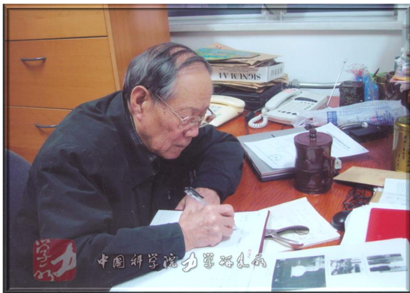
2003年 -- 退而不休，鄭哲敏院士在中國科學院力學研究所照常繼續研究工作。 2003 -- Academician Cheng Che-Min in his office of the Institute of Mechanics, Chinese Academy of Sciences