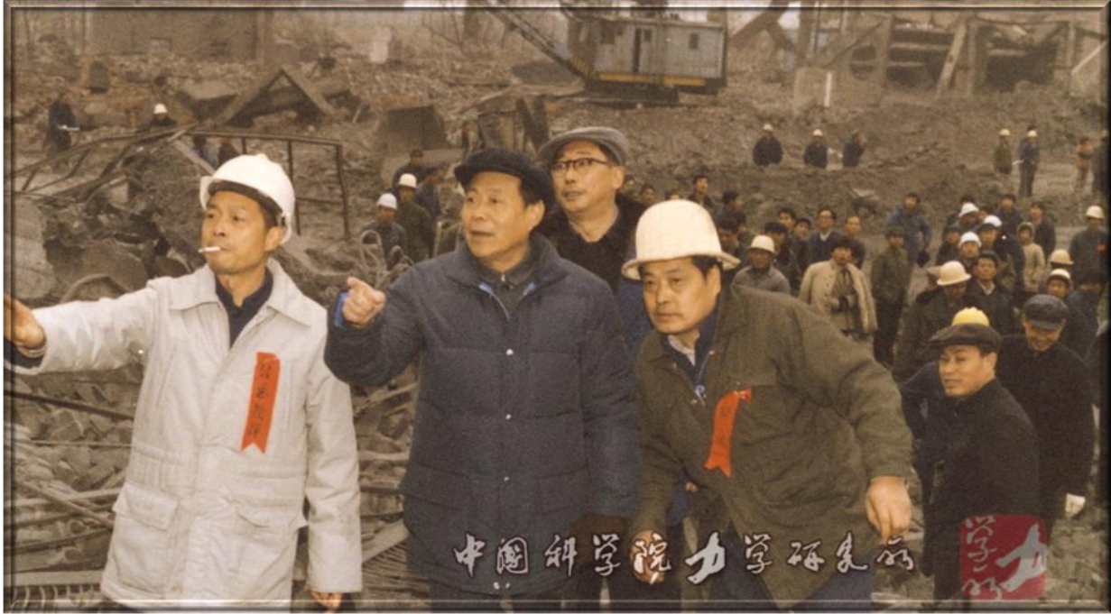
1984 年 -- 鄭哲敏(左2)視察北京石景山電廠爆破拆除現場 1984 -- Cheng Che-Min (L2) inspects the blasting demolition site of Shijingshan Power Plant in Beijing, China.