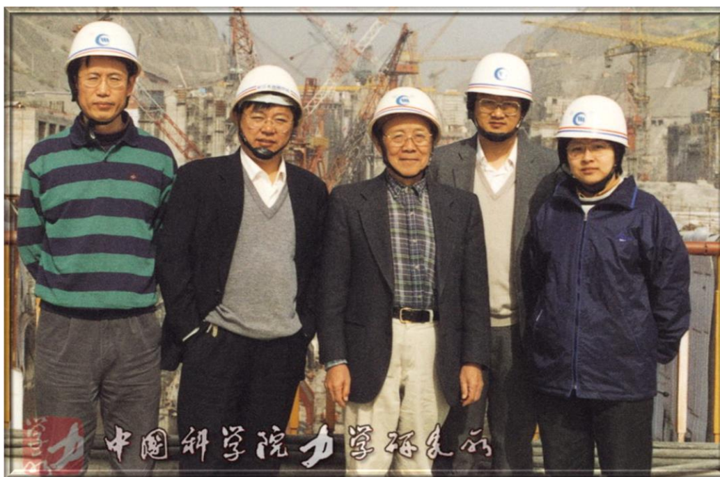
2002年 -- 《三峽三期圍堰爆破拆除方案設計與研究》項目驗收後，鄭哲敏（中）視察三峽船閘工地。 2002 -- Cheng Che-Min (C) inspects the lock site of the Three Gorges.