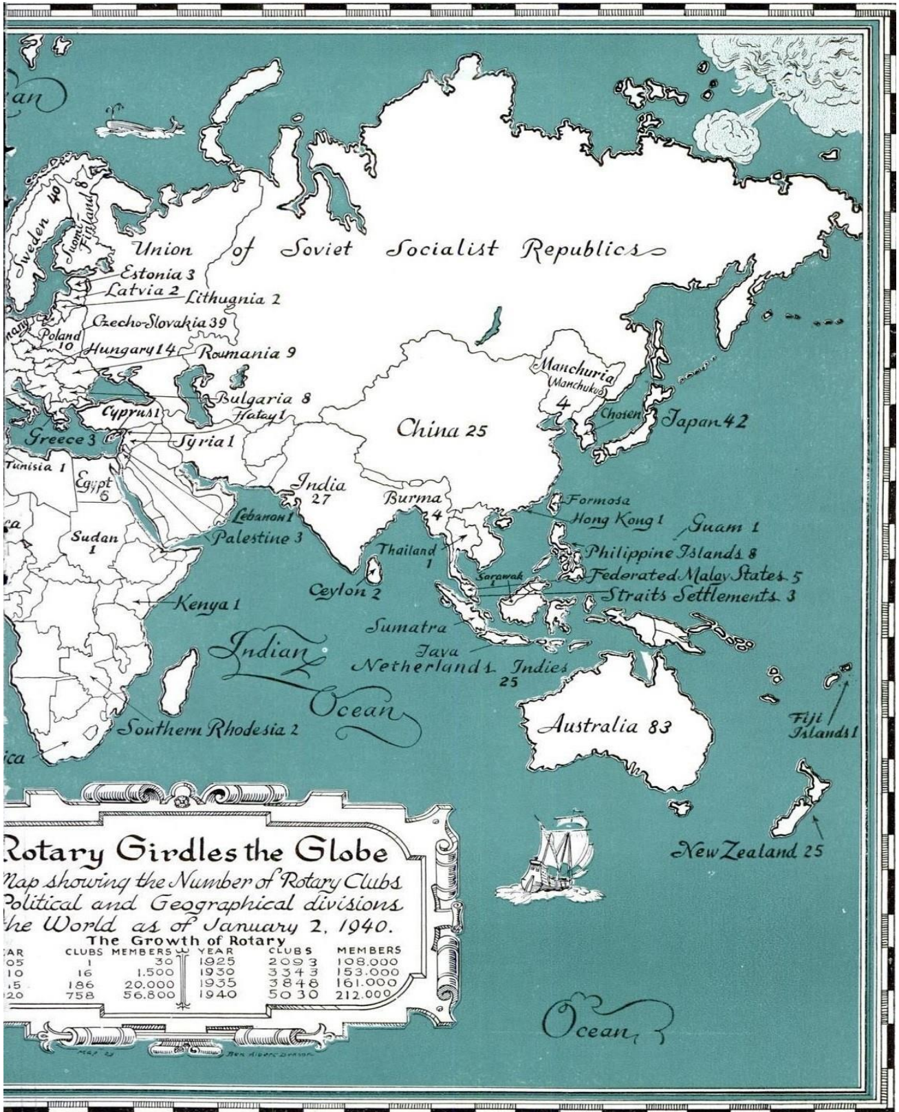
1940年1月國際扶輪地圖顯示日滿扶輪聯合會會員社的分布情況