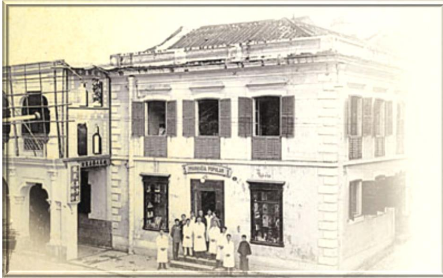
The Farmácia Popular at 16 Largo do Senado 新馬路議事亭前地 16 號-便民藥房