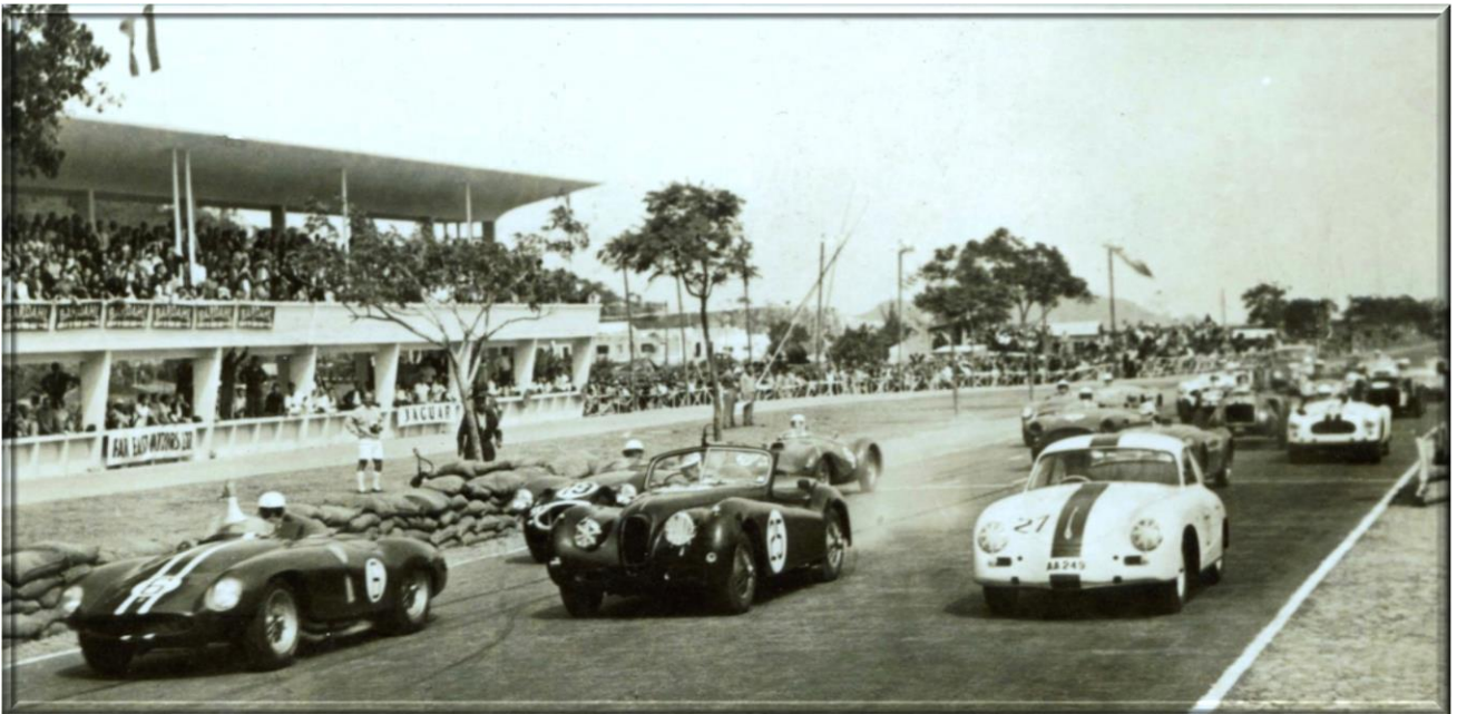
The international event of annual Grand Prix