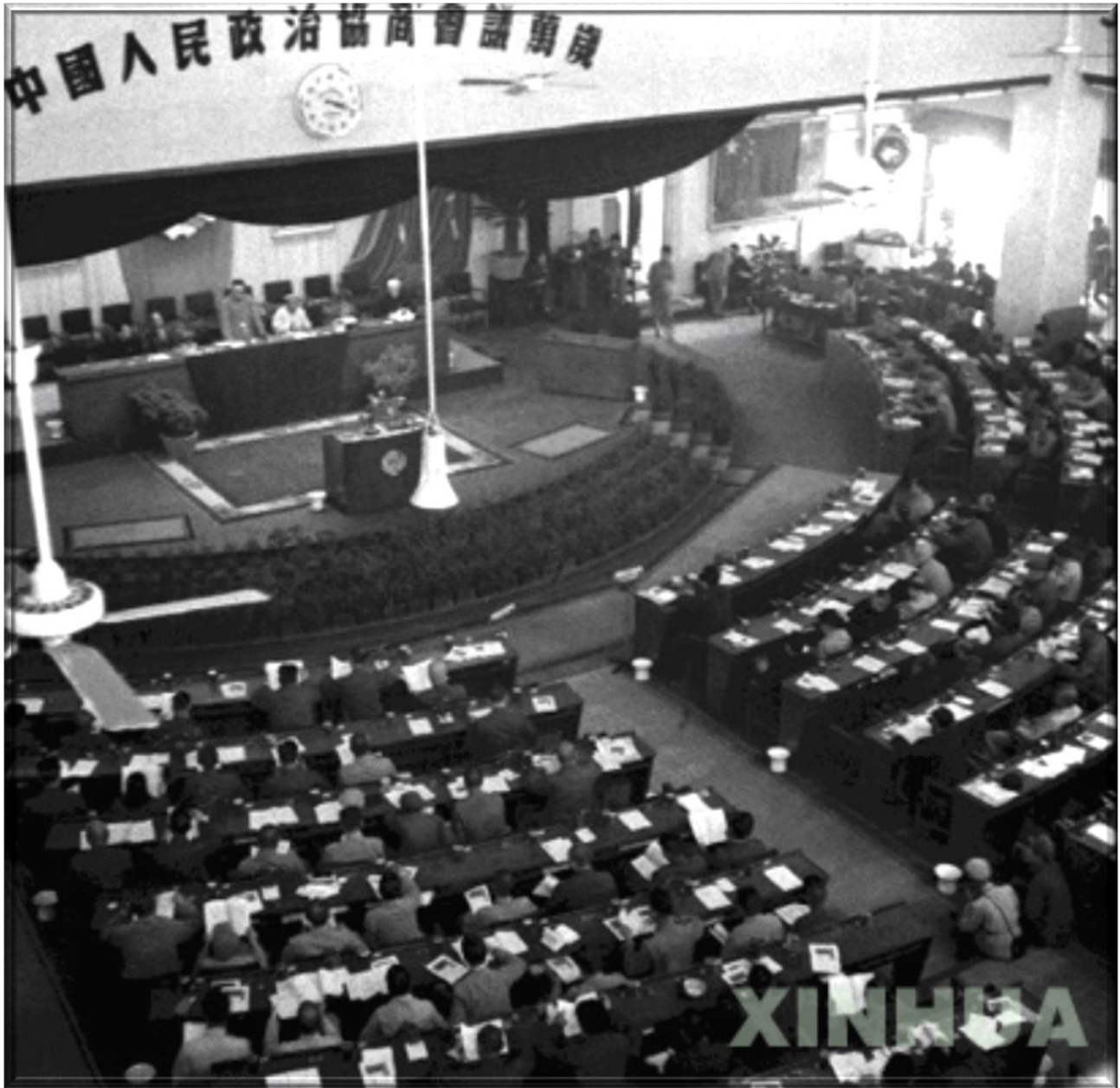
中國人民政治協商會議第一屆全體會議於1949年9月21日至30日在北平舉行