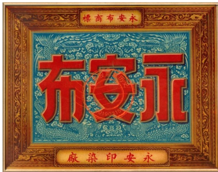
永安布商標，由永安印染廠印製。

The Oriental Hotel located at the Wing On Department Store Building was the regular meeting venue of Shanghai Rotary Club in 1946.