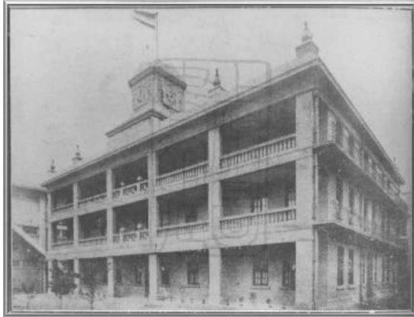
上海永安紡織股份有限公司——第一廠事務所

Wing On Textile Manufacturing Co., Ltd., office building of Mill No.1, Shanghai